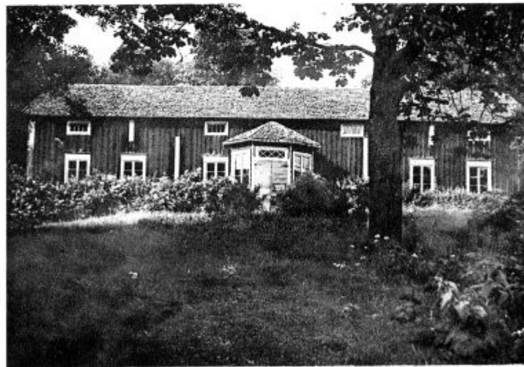
Lammin uudistalo Sammatissa. Lönnrot osti sen 1868 ja asui siinä kuolemaansa asti.