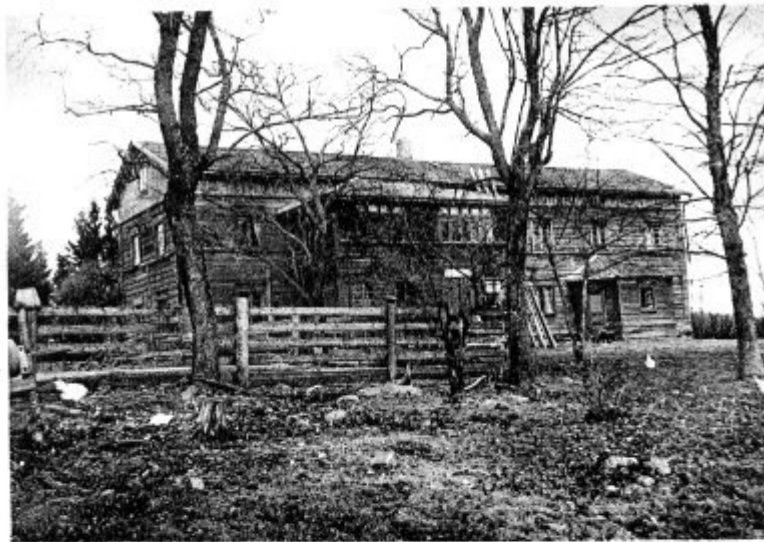
Nikun talo Sammatissa; Lönnrot omisti sen 1860—76.